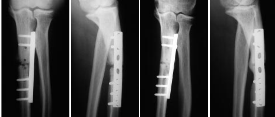
Figura 2. (Caso n.o 6). A y B: Rx AP y lateral antes del tratamiento. C y D: Control radiográfico definitivo al año.

El máximo número de impulsos aplicados fue 10.000, y se varió la dirección de aplicación cada 500 impulsos. La duración máxima del procedimiento fue de 90 min. y después del mismo, los pacientes fueron inmovilizados con yeso cuando existía duda sobre la estabilidad del foco. El tiempo y el tipo de inmovilización se escogieron de acuerdo a las características individuales de la localización y tipo de fractura. En las pseudoartrosis de tibia se inició la deambulación con carga a los 7 días, previo recambio de la férula por un yeso suropédico con tacón de marcha.