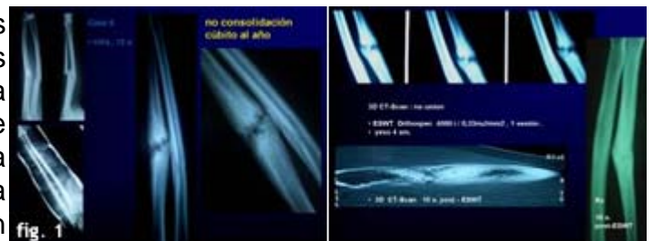
Fig. 1. Niña de 12 años que sufre fractura de ambos huesos del antebrazo y se trata con osteosíntesis intramedular habitual. No consolida el cubito, presenta dolor y pérdida parcial de la función. El tratamiento de la no consolidación es volver a operar colocando una placa y tornillos junto a injerto óseo y esperar la correcta consolidación. Esta niña fue tratada con Ondas de Choque y se logró una adecuada solución en 10 semanas, donde muestra consolidación y evita definitivamente la solución quirúrgica.

Estos pacientes no cicatrizan dentro de períodos normales aceptados para distintos segmentos óseos y la principal razón la constituye una incapacidad de formar un puente vascular entre los fragmentos de la fractura desde donde se origina el callo óseo que permite cicatrizar. La aplicación de las Ondas de Choque logra estimular la neo-angiogénesis de la zona y se aprecia la aparición de callo óseo en el tiempo esperado normal, logrando así evitar cirugías de injerto óseo más osteosíntesis.